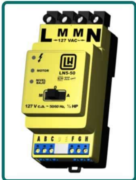
Diagrama de conexiones